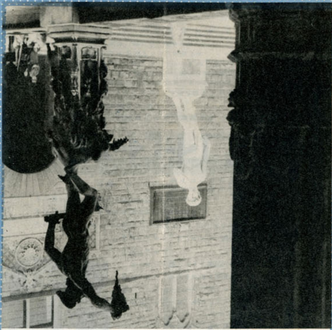
1955年 東京 千代田区

望遠レンズとして遠景、スポーツ撮影等に其の望遠力を100%に発揮、包括角度17°画像は標準レンズの2.7倍